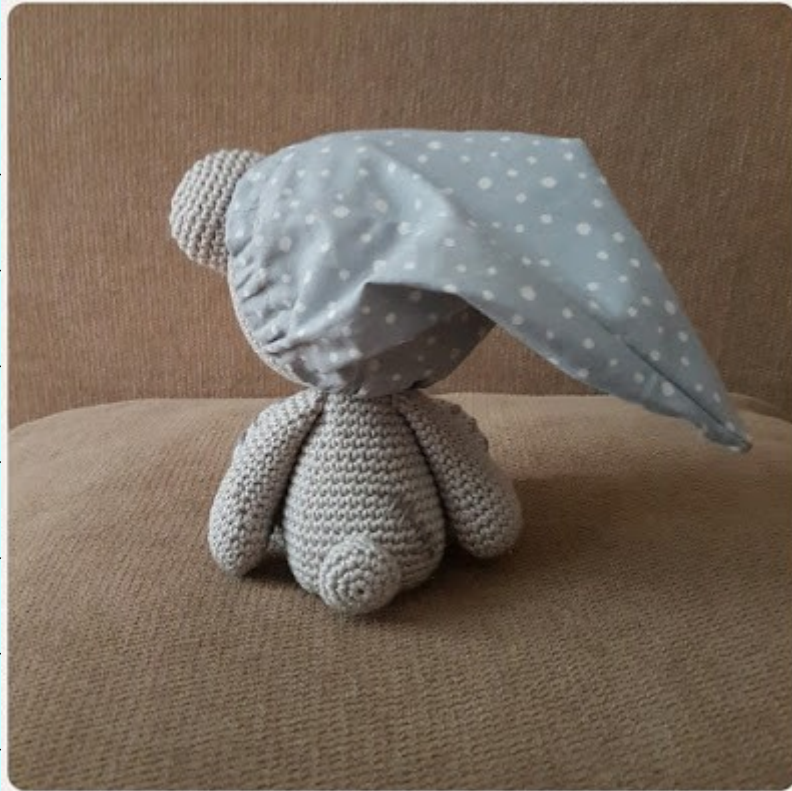
From the back, with the cap in the wind.