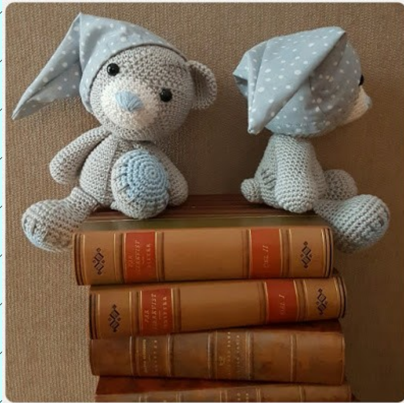
Des Histoires au coucher

So, this is the pattern for my design The Bedbugbear . A neat little guru that likes to hang out in beds and collect nightmares. The Bedbugbear stores the dreams in its night cap, so it really prefers to keep the cap on, no matter what. However, I will warn you right away - I don't have any pattern for the cap since I really just sew it by feeling. I measure the head of the guru and then I just cut out two triangular pieces of cloth, add a rubber band in the lining and just try to make the best of it. Anyhow, back to the bedbug. I use the yarn Tilda from Svarta Fåret (big surprise) and by doing so, this particular bear will measure about 19 cm while standing up, and 15 cm while sitting down. Hook size: 2,5. Safety eyes size: 10 mm.