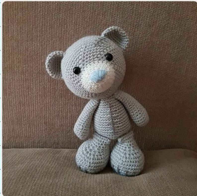
Rare footage: The Bedbugbear without its cap.