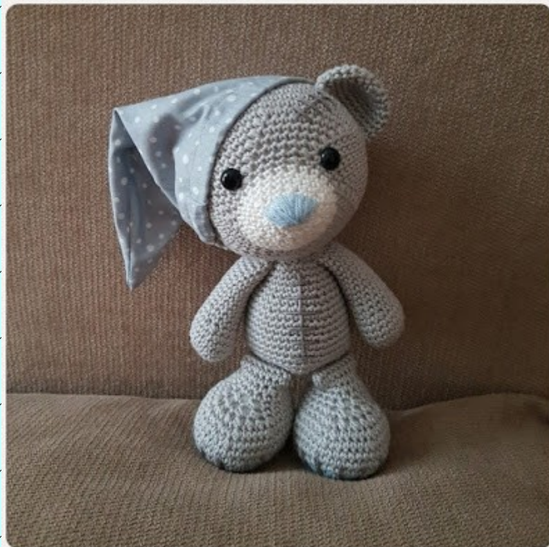
Juste avant de coucher l'ourson