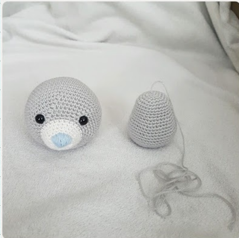
As you can see, the body is pear shaped.